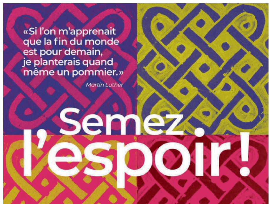
Campagne DM 2022.

Vendredi 28 octobre , En Biolle, Monthey. ▴