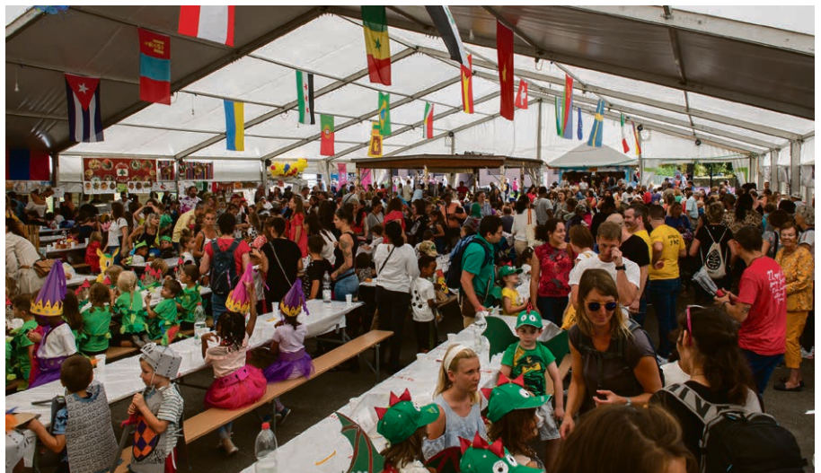
La fête des couleurs a rencontré un vif succès.

Le dimanche 4 septembre, l'Association AMIS a eu le plaisir d'être invitée à un culte de solidarité avec les réfugiés, à l'église du Cloître à Aigle. L'occasion de présenter les membres de l'équipe d'animation, de rappeler la mission de notre association en matière d'intégration, d'accueil et de solidarité ainsi que notre lien avec l'EERV, au nom des valeurs chrétiennes et humanistes que nous partageons. L'assemblée a même eu droit à un concert spécial, celui du groupe de percussions du monde « Makusol », composé d'enfants de l'Association AMIS et de notre animateur socioculturel et musicien Christian. Une prestation rythmée et très appréciée !