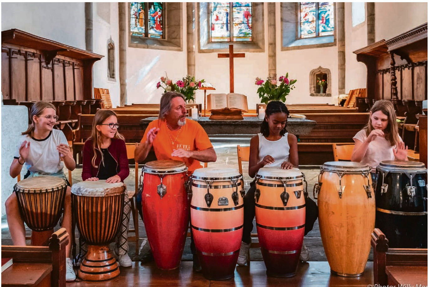
Culte avec l'association AMIS et le groupe Makusol du 4 septembre.