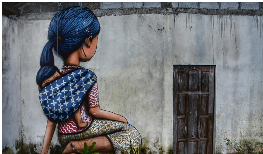
Il ne reste plus qu'à franchir le seuil !