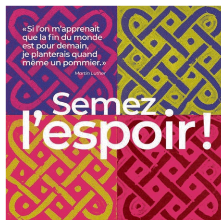
Campagne DM 2022.

Vos dons (CH08 0900 0000 1000 0700 2) permettent : 1) de mettre en pratique des savoirs abordés en théorie : chaque classe gère une surface de terrain où elle fait pousser ses légumes et féculents ; 2) de mettre sur pied un programme scolaire sur cinq ans comprenant une formation théorique en agroécologie pour les enseignants et enseignantes et les élèves ; 3) de diffuser ce programme auprès d'autres écoles ; 4) d'augmenter la production agricole et l'autonomie alimentaire de l'internat, qui offre également un repas par jour aux élèves externes ; 5) de développer la production d'huiles essentielles distillées sur place.