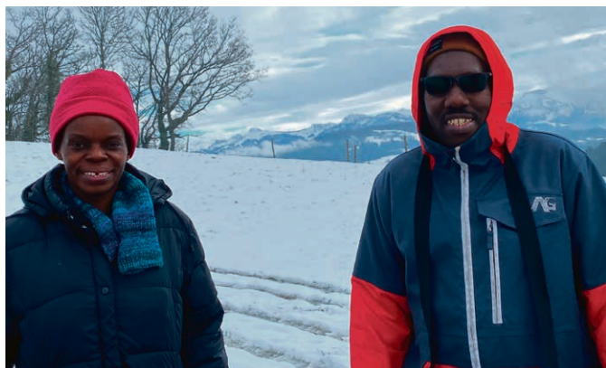
Marguerite et Prince à la découverte des paysages enneigés.