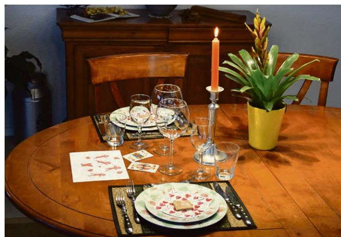
Un repas en amoureux? Réservez vite votre table pour la Saint-Valentin!