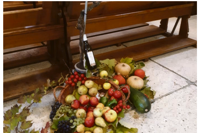
Généreuse décoration de l'église préparée par la famille Dentan à l'occasion de la Fête de l'offrande le 7 novembre.

Vous venez de devenir parents. C'est un moment important et particulier dans votre parcours de vie; il la change à tout jamais. C'est « indélébile », car on reste parents à vie, quoi qu'il arrive par la suite. C'est un « changement de statut ». Et cela se fête! Par ce que l'on appelle un « rite de passage ». De tels rites structurent nos vies, en marquent les étapes importantes, disent leurs sens et profondeur. L'Eglise, la communauté paroissiale de votre lieu d'habitation se réjouit de le partager et de le fêter avec vous, si