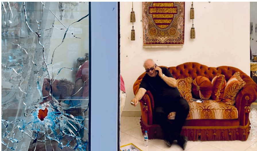
Un habitant de Tayouneh le soir des combats.