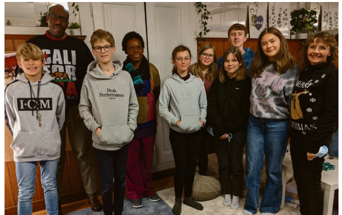
Les catéchumènes et les pasteurs rwandais.

gospel, « Les Voies du Cœur ». Bienvenue à vous le vendredi 4 mars, à 18h , au temple de Lutry. Collation à l'issue de la célébration avec les recettes classiques de la région.