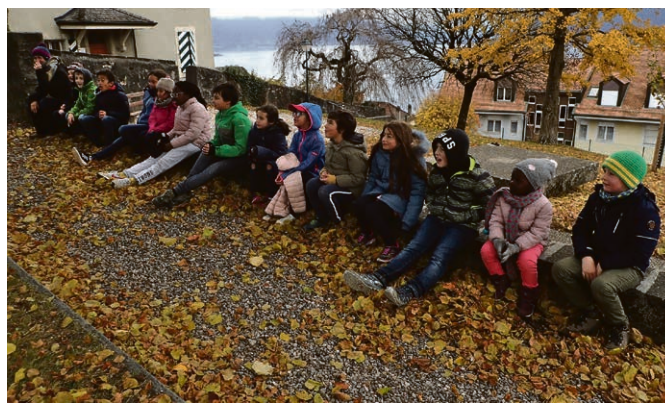
Jolie ribambelle.

On peut s'y abonner par un lien en page d'accueil de notre site internet. Vous pouvez également y publier vos propres prières ou témoignages.