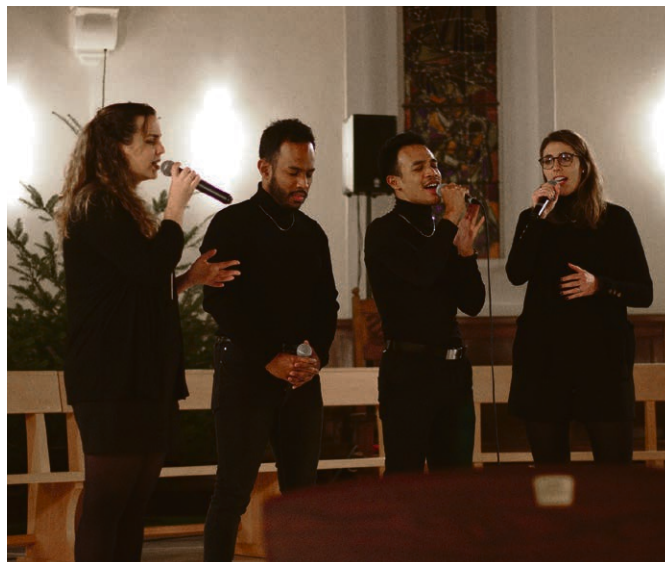
Concert Gospel du 5 décembre à Chexbres.