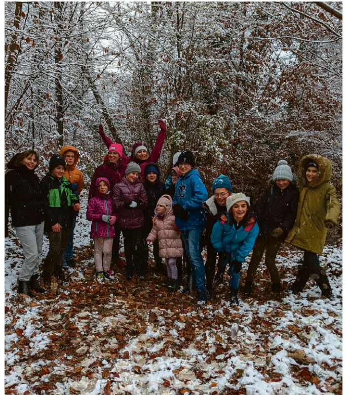
Notre équipe de courageux catéchumènes en route vers le feu de l'Avent !