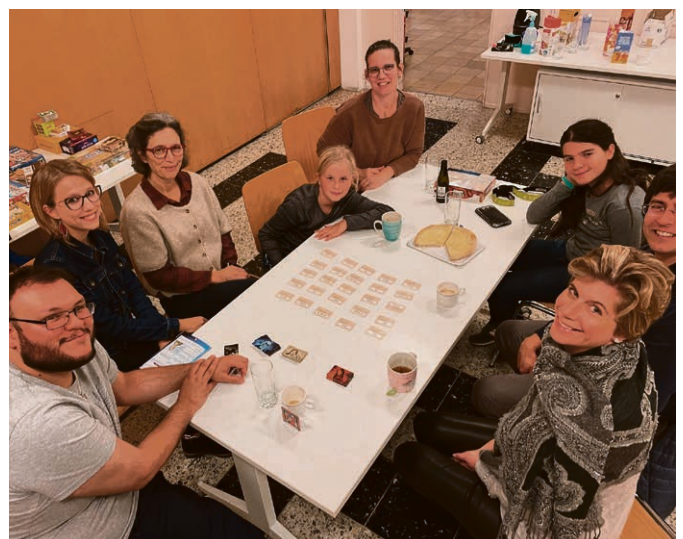
Une joyeuse équipe intergénérationnelle se réunit régulièrement au cours des soirées «Jeux» à la Rosiaz.